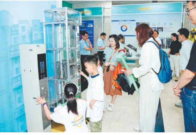
“特种设备安全日”活动现场

6月29日是全国特种设备安全日,今天上午,20多名中小学生和家走进江苏省特检院老旧电梯安全评估展示馆,参加以“守护特种设备安全 助力高质量发展”为主